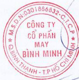
Võ Quốc Hào